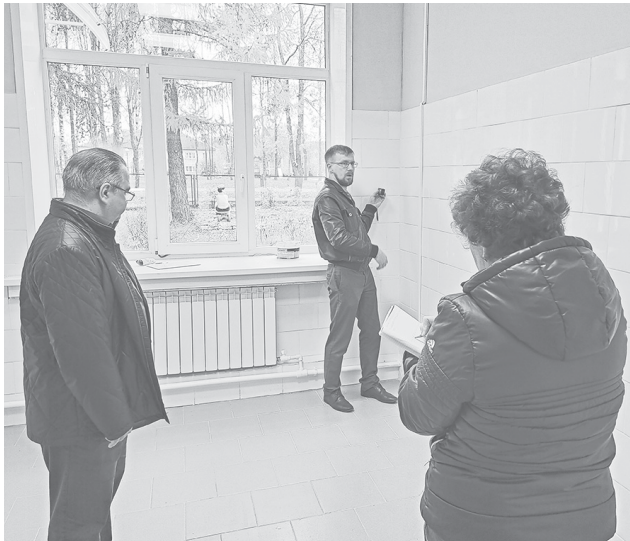
Отделка кабинета в здании будущей амбулатории пос. Дубки