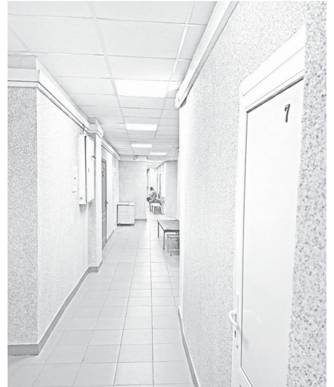
В коридоре поликлиники №1 пос. Красные Ткачи стало светлее