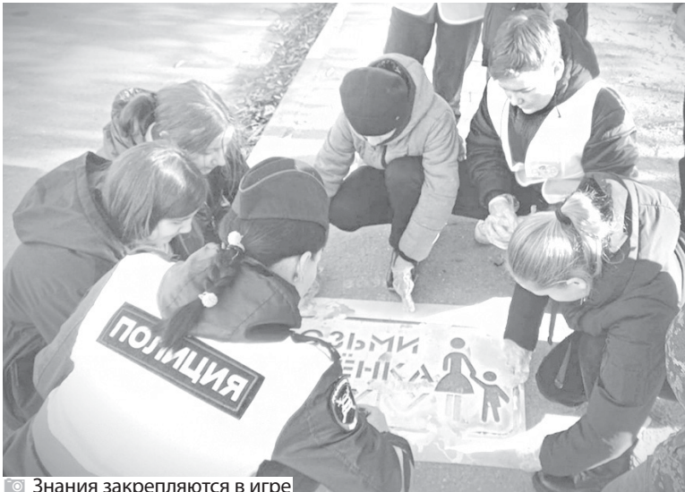
Знания закрепляются в игре