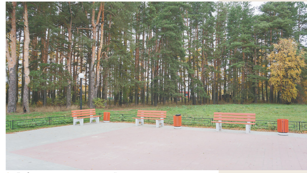
Любимое место отдыха жителей деревни

– В этом году мы частично отремонтировали в асфальтовом исполнении улицу Молодежную, ранее – улицу Северную. Ежегодно проводим текущий ремонт дорог. Также в приоритете у нас благоустройство, борьба с мусором. Все эти вопросы решаем в рабочем порядке.