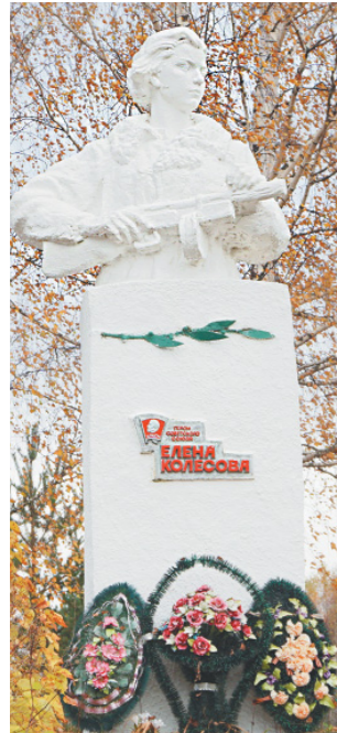
Памятник Герою Советского Союза Елене Колесовой