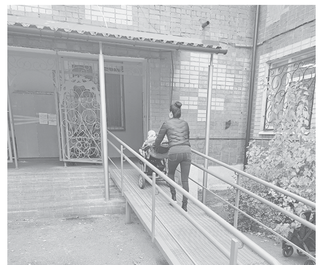
Новый удобный пандус на входе в амбулаторию пос. Ивняки

Администрация ЯМР и руководство ЦРБ продолжают следить за выполнением ремонтных работ капитального характера на всех готовящихся к сдаче объектах сельской медицины.